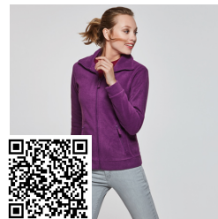
PIRINEO WOMAN CQ1091