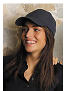
NEOBLU TOM 03204