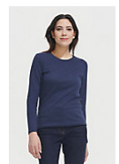
SOL'S Imperial LSL WOMEN 02075