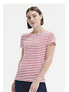
SOL'S MILES WOMEN 01399